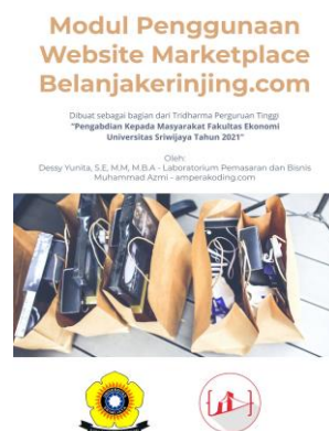
Gambar 1. Modul Website Belanjakerinjing.com

Pelaku usaha diberikan panduan berupa modul sebagai bentuk pedoman bagi pemakaian dan pemanfaatan website. Modul ini diberi nama sesuai dengan daerah pengabdian yang dilakukan yaitu Belanjakerinjing.com. Modul ini terdiri dari panduan mulai dari Homepage, halaman kategori produk, halaman hasil pencarian produk, halaman detail produk, halaman daftar member, halaman login, halaman lupa password, halaman setelah klik tombol reset password, konfirmasi lupa password di email, halaman reset password, halaman jika berhasil login, halaman daftar produk, halaman tambah produk baru, halaman ubah data produk, halaman profil toko, halaman edit profil toko, halaman edit profil akun, dan halaman ganti password. Berikut cover dari modul penggunaan website: