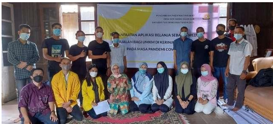
Gambar 2. Penyampaian Materi