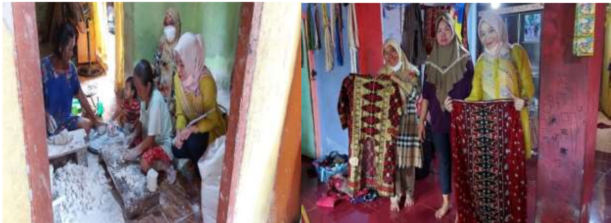
Gambar 3. Kegiatan pada tahap perencanaan: Mendatangi tempat usaha di Desa Kerinjing, Ogan Ilir

Tahap kedua, pelaksanaan kegiatan dilakukan dengan memberikan dan menjelaskan materi yang terkait dengan topik kegiatan. Pemateri akan menjelaskan materi mengenai definisi dari SDM dan perencanaan SDM, pentingnya perencanaan SDM, metode perencanaan SDM, serta komponen dalam perencanaan SDM. Selain memberikan materi, pemateri juga memberikan kesempatan kepada para peserta kegiatan untuk dapat memberikan pertanyaan mengenai hal-hal yang berkaitan dengan topik kegiatan ataupun di luar topik kegiatan. Hal ini dilakukan untuk mempertajam pemahaman mengenai materi yang telah dijelaskan dan mencoba memberikan solusi terhadap permasalahan yang sedang dihadapi oleh para pelaku usaha mikro terkait dengan pengelolaan usahanya.