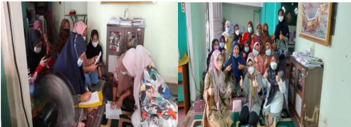
Gambar 5. Kegiatan pada tahap evaluasi: Melakukan evaluasi kegiatan

Tahap ketiga, yaitu evaluasi terhadap hasil kegiatan yang diharapkan. Melalui kegiatan ini diharapkan akan memberikan pemahaman bagi para pelaku usaha mikro dalam hal perencanaan SDM pada era digital.