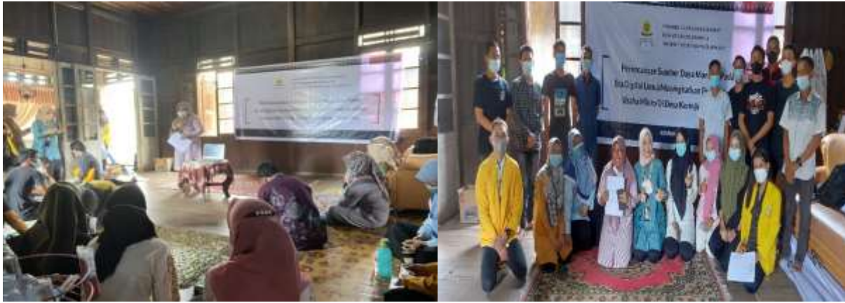
Gambar 4. Kegiatan pada tahap pelaksanaan: Pemberian materi dan foto bersama dengan peserta kegiatan

Tahap ketiga, yaitu evaluasi terhadap hasil kegiatan yang diharapkan. Melalui kegiatan ini diharapkan akan memberikan pemahaman bagi para pelaku usaha mikro dalam hal perencanaan SDM pada era digital.