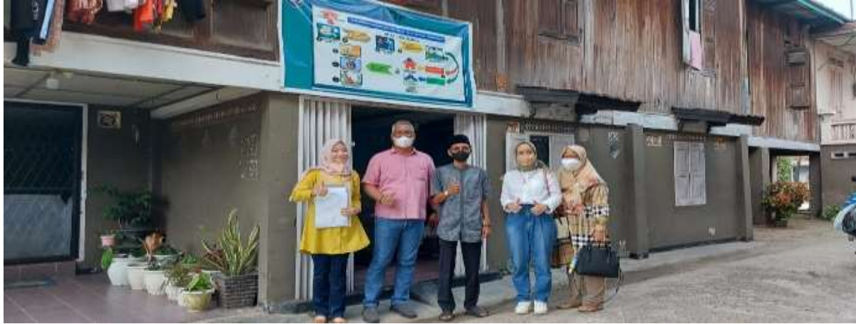
Gambar 2. Kegiatan pada tahap perencanaan: Pertemuan dengan kepala desa untuk mengidentifikasi masalah dan memilih khalayak sasaran

masyarakat desa khususnya oleh para pelaku usaha mikro. Berdasarkan hasil survey, diidentifikasi terdapat beberapa permasalahan yang dihadapi oleh para pelaku usaha mikro yang ada di Desa Kerinjing, Ogan Ilir diantaranya masalah pada tingkat pengetahuan, ketrampilan, penguasaan teknologi, dan ketersediaan SDM yang cukup handal dalam menghadapi era digital. Berdasarkan identifikasi masalah tersebut, maka khalayak sasaran yang dipilih pada kegiatan pengabdian masyarakat ini adalah pelaku usaha mikro yang ada di Desa Kerinjing, Ogan Ilir.