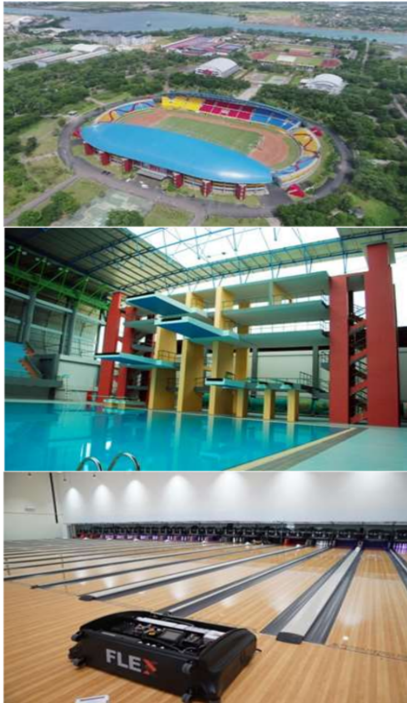
Gambar 1. Fasilitas Olahraga di Jakabaring Sport City (JSC)